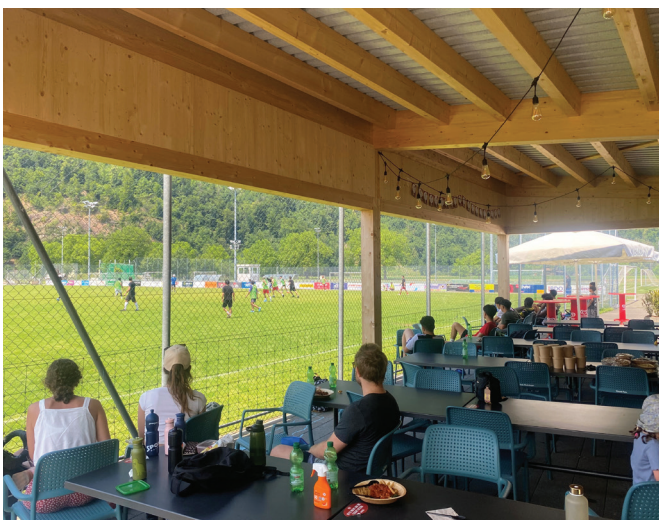
Zuschauer aus der Bevölkerung beobachten das Spielgeschehen.