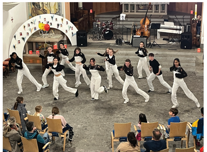
Hip Hop-Dancegruppe in der Kirche Emmetten.