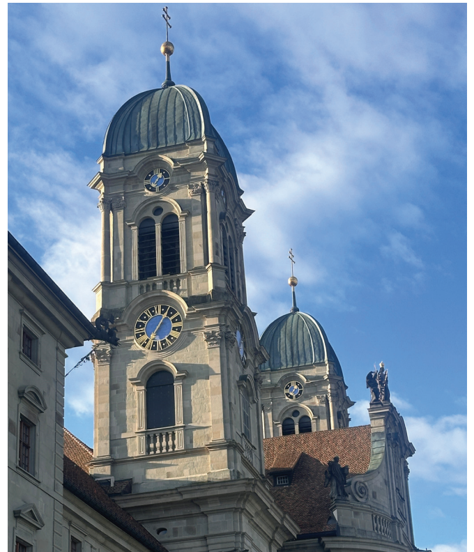
Die Klosterkirche Einsiedeln, Ziel der zweiten Landeswallfahrt.

Die traditionellen Landeswallfahrten nach Ostern boten dem Fachbereich auch im Berichtsjahr eine wertvolle Gelegenheit, seine Arbeit sichtbar zu machen und den Austausch zu pflegen.