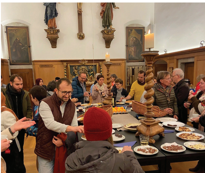
Die traditionelle Agape im Anschluss an das interreligiöse Gebet im inneren Chor der Kapuzinerkirche Stans lud Menschen aller Generationen zur Begegnung ein.

Im Oeki Stansstad folgte eine gut besuchte Podiumsdiskussion über das Gewalt- und Friedenspotenzial der Religionen. Vertreterinnen und Vertreter verschiedener Glaubensgemeinschaften diskutierten offen, differenziert und mit persönlicher Tiefe über Chancen und Herausforderungen religiöser Friedensarbeit.