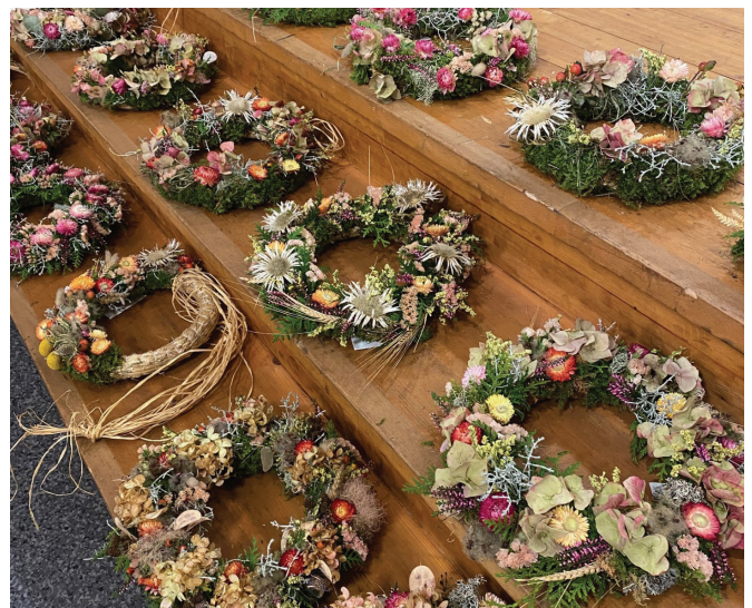
Sonntags-Feyr-Treffen 2025 Büren, Bild: Martina Christen-Hendry

Zum Abschluss des Abends wurden die Teilnehmerinnen von der Sonntags-Feyr-Gruppe Büren mit feinen Süßigkeiten, Kaffee, Tee und Süssmost verwöhnt.