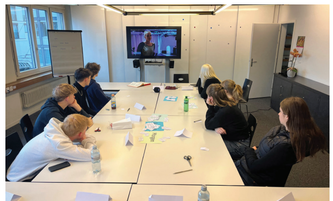
Wie denken Jugendliche über Gott? Wo erfahren sie ihn im Alltag? Diesen und weiteren Fragen gingen die Firmanden an den beiden kantonalen Firmkurstagen nach.

Durch Gespräche, Auseinandersetzung mit Bibeltexten als Ort der Gottesbegegnung und den Austausch in der Gruppe erkannten die Jugendlichen, dass Freundschaft – sei es zwischen Menschen oder mit Gott – auf Vertrauen, Offenheit und gegenseitigem Entgegenkommen beruht und dass Beziehungs- und Glaubensarbeit ein lebenslanger Weg ist.