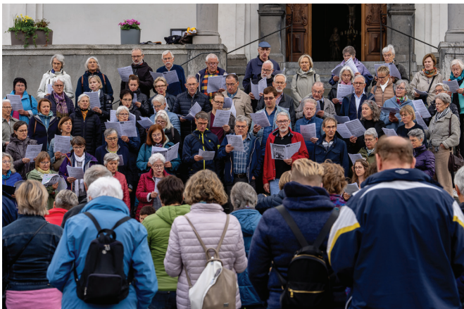
Menschen soweit das Auge reicht: Das war die Lange Nacht der Kirchen 2025. Hier auf dem Bild das offene Singen auf der Stanser Kirchentreppe.

Ende Mai fand in Nidwalden die Lange Nacht der Kirchen statt – ein grosser Erfolg. Über 1'000 Menschen aus dem Kanton und der weiteren Umgebung nutzten die Gelegenheit, Kirche einmal anders zu erleben. In über zehn Kirchenräumen sowie an weiteren Innen- und Aussenorten wurde ein vielfältiges Programm geboten – mit Musik, Lichtinstallationen, kreativen Impulsen, Begegnungen und Momenten der Besinnung.