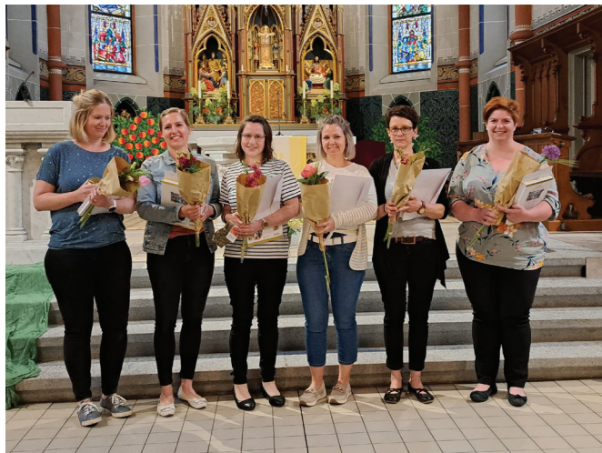
HGU-Abschlussfeier 2025