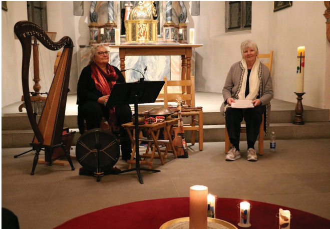
Woche der Religionen.

Die diesjährige Woche der Religionen Nidwalden Mitte November zog zahlreiche Interessierte an – unter ihnen auch zwei Regierungsräte. Der Fachbereich war auch in diesem Berichtsjahr wieder aktiv in der Arbeitsgruppe vertreten und damit mitten in der Vorbereitung und Umsetzung dieser vielfältigen Dialogwoche.