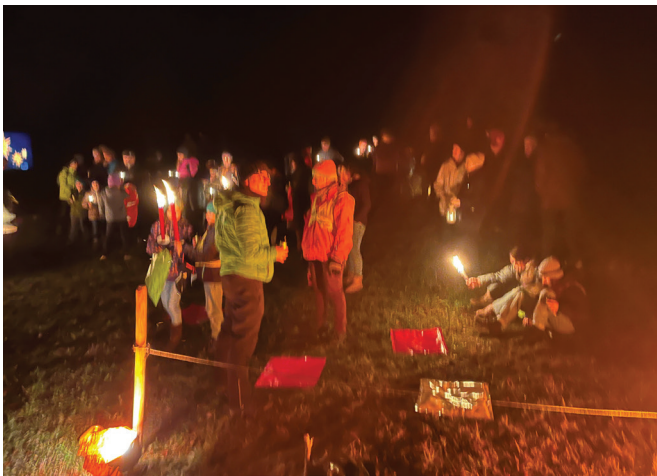
Gemeinsam Gott suchen und Gott feiern: Familien vor der Unteren Ranftkapelle vor Beginn des nächtlichen Gottesdienstes.

Auch im Jahr 2025 durfte der Fachbereich die Schlussfeier des Familienwegs im Rahmen des Ranfttreffens gestalten und verantworten. Unter dem Thema „Spuren im Schnee“ machten sich zahlreiche Familien mit Kindern auf einen gemeinsamen Weg voller Entdeckungen und Erlebnisse. An verschiedenen Stationen konnten sie spielerisch erfahren, welche Spuren Menschen in Natur, Gemeinschaft und Herzen hinterlassen – und wie solche Spuren unser Zusammenleben prägen. Was fehlte an diesem Wochenende vor Weihnachten, war einzig der Schnee.