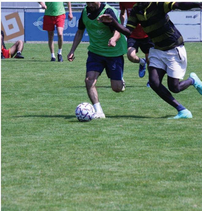
Teilnehmende Fussballer in Aktion.

Bei sehr hohen Temperaturen wurde trotz allem vollen Einsatz gebracht.