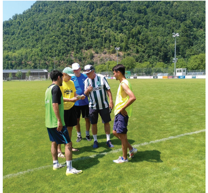
Schiedsrichter und Spieler studieren den Spielplan.