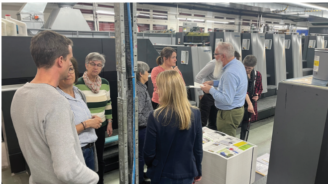
Die Redaktorinnen und Redaktoren werden fachkundig durch die Druckerei Odermatt geführt und lernen dabei die Druckprozesse kennen.

Die Redaktorinnen und Redaktoren des Pfarreiblattes treffen sich einmal im Jahr mit dem Präsidium der Pfarreiblattkommission sowie Vertretern der Druckerei Odermatt. Dieses Treffen, zu dem dieser Fachbereich jeweils einlädt, bietet eine wertvolle Gelegenheit, um sich über pfarrenübergreifende Themen auszutauschen, aktuelle Fragen rund um das Pfarreiblatt zu besprechen und die Zusammenarbeit zu vertiefen.