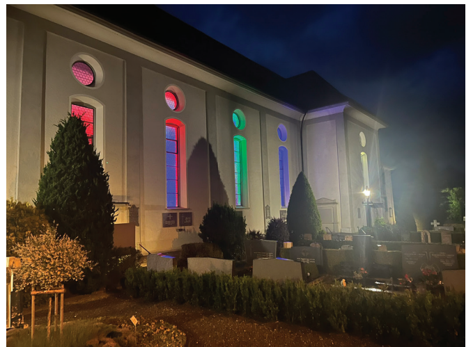
Die Buochser Pfarrkirche in farbiges Licht gehüllt.

Das grosse Engagement der Beteiligten – von Freiwilligen über lokale Künstlerinnen und Künstler bis hin zu Seelsorgenden – machte den Abend zu einem besonderen Erlebnis. Kirche wurde sichtbar als Ort des Vertrauens, der Offenheit und der Lebensfreude.