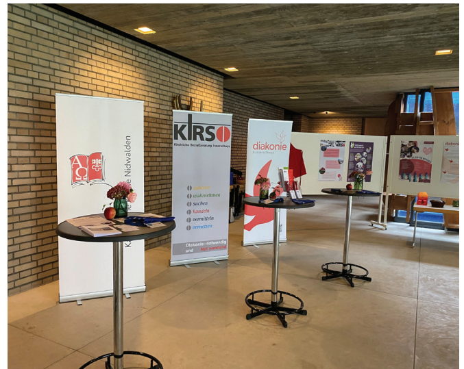
Die Stände der Urschweizer Diakoniestellen.

Am Samstag, 27. September 2025 fand in Ingenbohl der zweite von drei Anlässen des Bistumsjahres statt. Der Anlass stand unter den Leitbegriffen Hören – Handeln – Hoffen und war mit einem Sternmarsch zum Generalvikariat Urschweiz auf den Schwerpunkt Hören / Diakonie ausgerichtet. Dabei stellten sich unter anderem die vier Sozialberatungsstellen der Bistumsregion mit Ständen und einem gemeinsamen Auftritt vor.