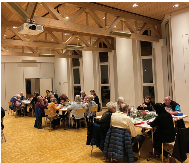
Teilnehmende der Offenen Weihnacht bei Speis und Trank.

Ein angebotenes Taxi als Fahrdienst sorgte dafür, dass alle Gäste sicher nach Hause gelangen konnten. Gegen 22 Uhr endete die Feier mit einem herzlichen Dank an alle Beteiligten.