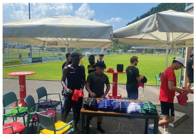
Alle Teilnehmenden erhalten ein Geschenk.