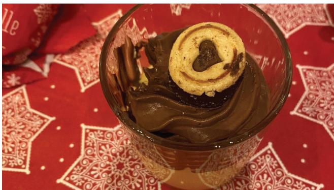
Köstlich angerichtete Weihnachtsüberraschung.